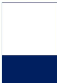
1/3 Seite quer